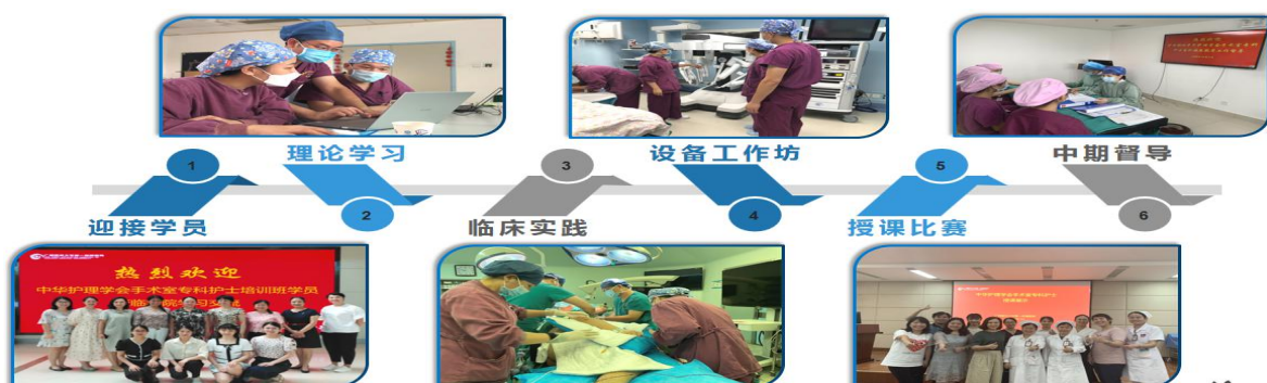
广西手术室专科护士培训理论培训、临床实践及中华护理学会手术室专科护士临床实践

5. 专科护士培训。依托广西手术室专科护士培训理论培训、临床实践基地及中华护理学会手术室专科护士临床实践基地，以需求为导向，以岗位胜任力为核心，开展区内外护理骨干人才培养，2020~2023 协助培养区内专科护士 178 人，培养区外专科护士 2 人（其中江西医科大学第一附属医院 1 人、郑州大学第一附属医院 1 人）。