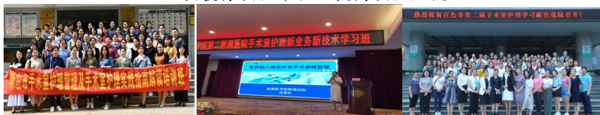
地、市、县级继续教育培训班