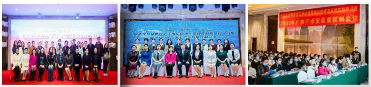
手术室专业委员会学术年会、全区质量控制会议与国家级和省级继续教育项目结合，提高项目层次

(1) 将手术室专业委员会学术年会、全区质量控制会议与国家级和省级继续教育项目结合举办，提高项目层次，加强与中华护理学会、省护理学会的联系，聘请中华护理学会手术室专委会知名专家 16 人次进行专业知识的培训，保障继续教育质量；护士长及护理骨干受邀区内外，线上及线下授课 52 人次（其中区内 30 人次，区外 22 人次）。