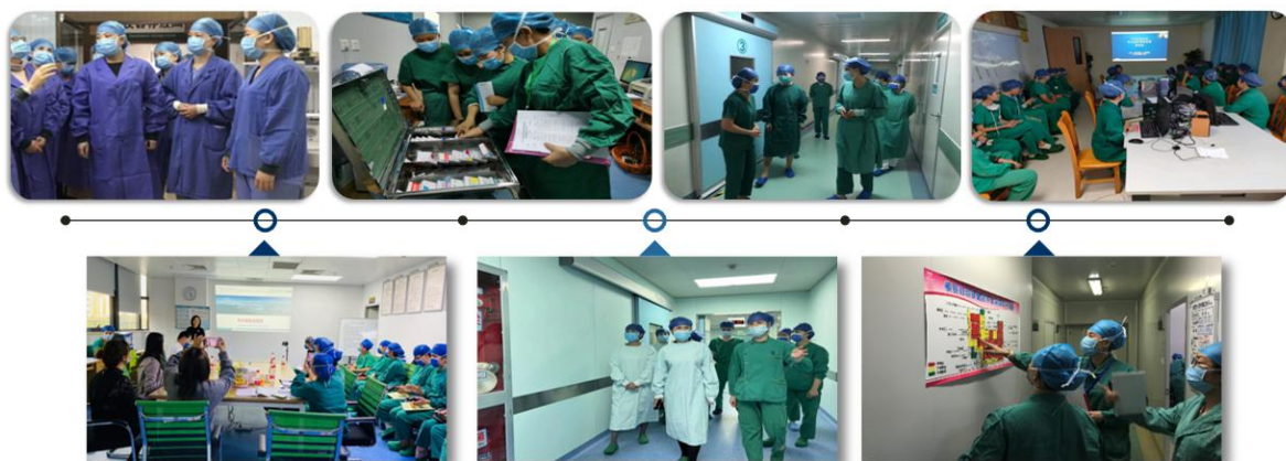
深入基层督导手术室护理服务质量并进行质控标准解读与培训

(2) 推行质控中心根据国家政策及手术室的相关规范标准、指南制定符合我省实际的《广西手术室质量作业指导书及质量考核标准》，以现场查看的形式督导手术室护理服务质量落实情况并进行标准解读与培训，规范手术室整体护理管理，使全区护理管理逐步达到规范化、同质化，提升手术室护理的专业水平和服务质量。